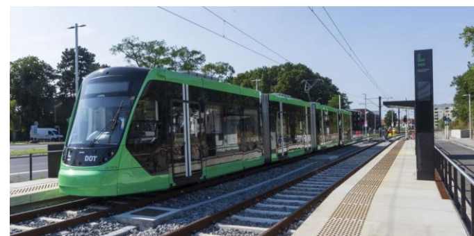
Rødovre Nord Station

Én letbanevogn erstatter 5 BRT-busser i indkøb